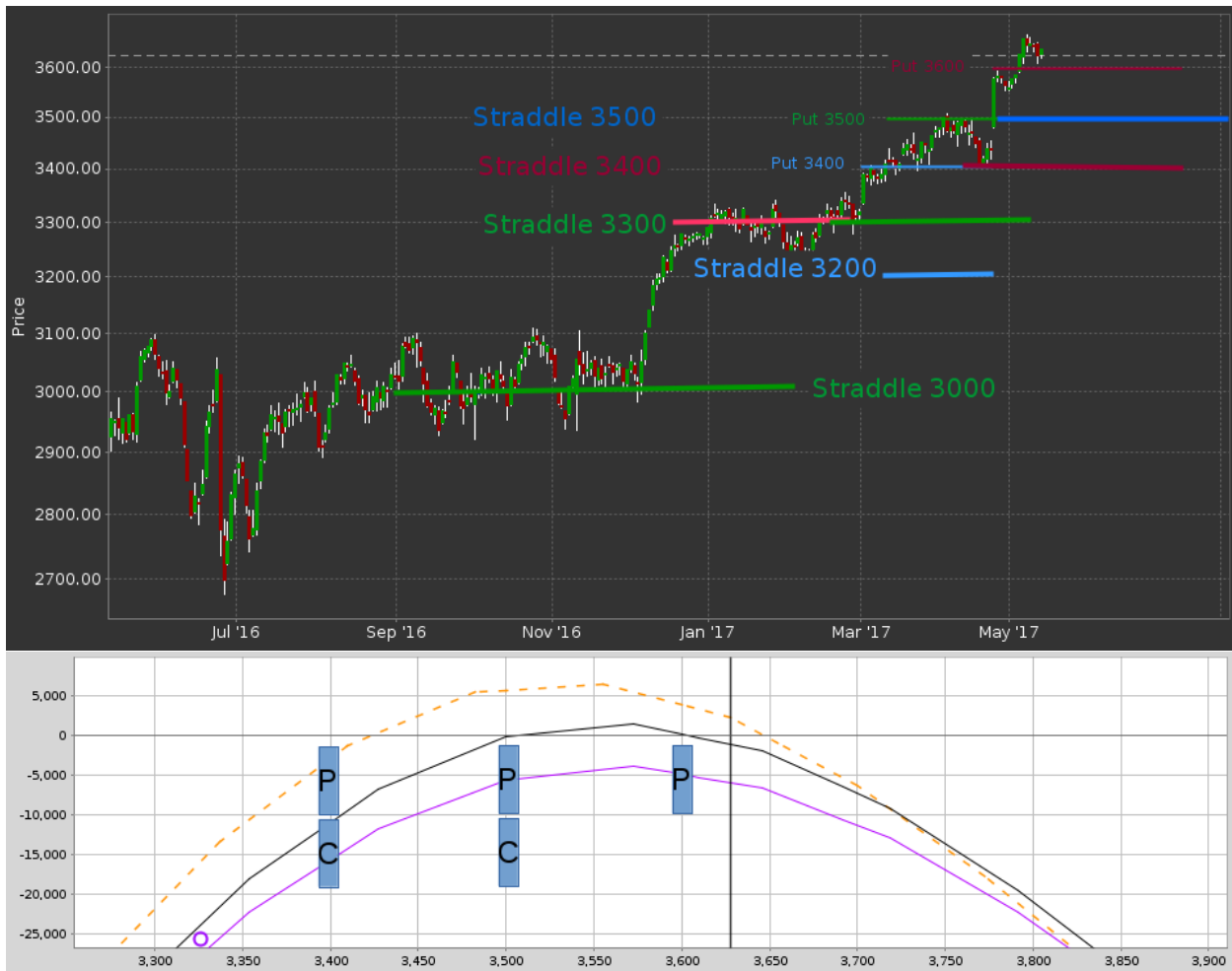
Abbildung 1: Preisentwicklung des EuroStoxx (Index) mit Optionsvisualisierung (oben) und Profitabilitätsdiagramm der aktuellen Positionierung (10 Kontrakte) (schwarz): Tageslinie, (violett): Volatilität +10%-Punkte, (gestrichelt): Projektion 30. Mai.

Update zur Optionsstrategie auf den EuroStoxx Nach den deutlichen Preisaufschlägen zur Präsidentschaftswahl in Frankreich konsolidierte der EuroStoxx moderat. Unsere aktuelle Positionierung: Straddle(3500)[Juli], Strangle(3400/3600) + Put(3400)[Juni].