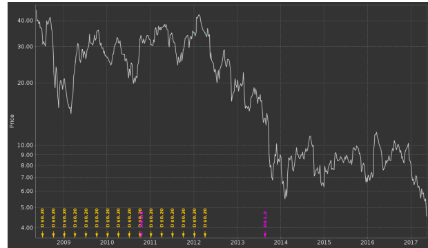
Abbildung 2: Preisverlauf von JC Penney seit 2008

Die Digitalisierung und der Trend hin zu einer »Online-Economy« trennt im Einzelhandel die Spreu vom Weizen. Der komentenhafte Aufstieg von Amazon , Alibaba & Co. fordert seinen Tribut in der Fläche. Betroffen sind REITs, Einzelhandelsunternehmen und unqualifizierte Mitarbeiter.