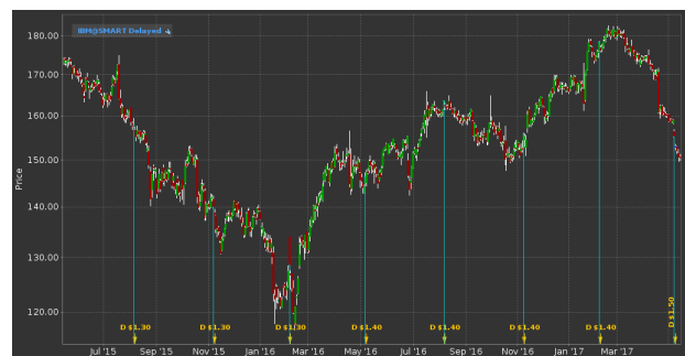
Abbildung 8: Preisverlauf der IBM

Zum Abschluß werfen wir einen Blick auf die in der Vorwoche besprochene IBM .