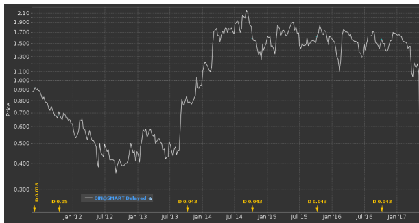
Abbildung 6: Preisverlauf der Quintis (6 Jahre)

Im Marktbericht 12/17 gingen wir ausführlich auf den Sandelholz-Plantagen-Betreiber Quintis ein, der von einem Short-Selling-Hedge-Fund attackiert worden war. Damals äußerten wir noch Zweifel an der Stichhaltigkeit der vorgetragenen Argumente.