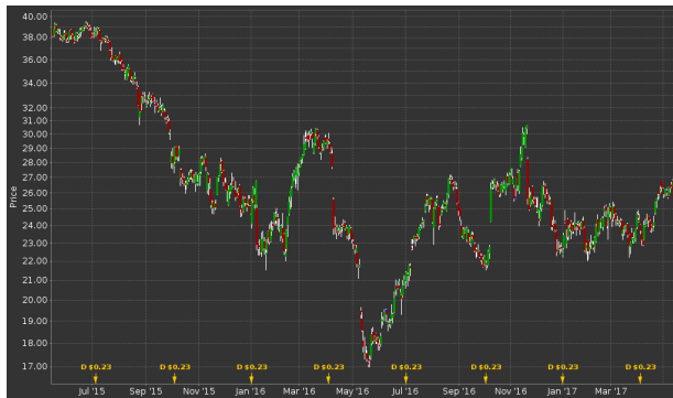
Abbildung 3: Preisverlauf von THE GAP (24 Monate)

Interessanterweise kann sich The Gap vom allgemeinen Preistrend abkoppeln. Das Unternehmen berichtet am Montag über das erste Quartal 2017.