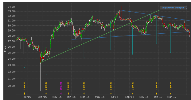
Abbildung 7: Preisverlauf der General Electric mit Trendlinien

Auch charttechnisch wurde in der vergangenen Woche viel Porzellan zerschlagen. Der fragile Aufwärtstrend seit September 2015 wurde bereits nach 12